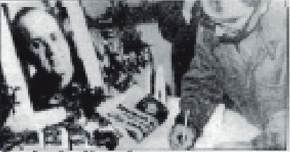
Cumhuriyet'in ana... Cumhuriyet'in ana... Cumhuriyet'in ana...

Uğur Mumcu'nun ölümü, Türkiye'nin en büyük politik skandalıdır. Çünkü Uğur Mumcu, Türkiye'nin en büyük politik skandalıdır. Çünkü Uğur Mumcu, Türkiye'nin en büyük politik skandalıdır. Çünkü Uğur Mumcu, Türkiye'nin en büyük politik skandalıdır.