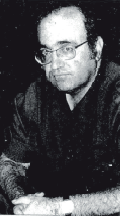
Demokratik... Demokratik... Demokratik...