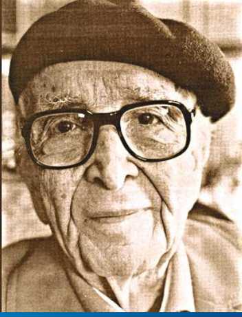
Ord. Prof. Dr. Hıfzı Veldet Velidedeoğlu

Hukukçu, yazar (D. 1904, İstanbul-Ö. 24 Şubat 1992). Trabzon Lisesi (1924) ve Ankara Üniversitesi Hukuk Fakültesi (1928) mezunu. Doktorasını İsviçre’de yaptı (1933). 1934 yılında İstanbul Üniversitesi Hukuk Fakültesine asistan olarak girdi. Burada aynı yıl doçentliğe, daha sonra profesörlüğe (1942) ve ordinaryüs profesörlüğe yükseldi. Velidedeoğlu, 1961 Anayasasını hazırlayan komisyonun üyeleri arasında da yer almıştı. İnceleme ve söyleşi türlerindeki yazıları Cumhuriyet ve Milliyet gazetelerinde yayımlanmıştır. ADD’nin kurucuları arasında yer alan Velidedeoğlu aynı zamanda derneğin onursal genel başkanıdır.