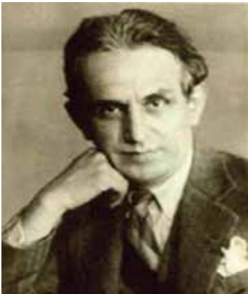
İbrahim Çallı, Akademi Yıllarında.

Resim eğitiminin Osmanlı sarayında ve toplumunda gördüğü ilginin artması, İstanbul'da ilk özel resim akademisinin açılması, resim, mimarlık gibi alanlarda güzel sanatlar eğitimi verecek bir kurumun varlığını gerekli kılmıştır. Bunun sonucunda Osman Hamdi Bey önderliğinde, 1883 yılında Sanayi-i Nefise Mektebi'nin açılışı gerçekleşmiştir. Özellikle Plastik sanatlar eğitimi alanında atılmış en büyük adımdır. Gelelim Bizim Çal' lı İbrahim'imize... 1882 yılında Denizli'nin Çal Kasabasında doğdu. 17 yaşında, idadiyi bitirdikten sonra Sanayi-i Nefise'de eğitim almak için İstanbul'a gitti. 1906'da Şeker Ahmet Paşa'nın desteğiyle Sanayi-i Nefise'ye giren İbrahim Çallı, 1910 yılında buradan mezun olduktan sonra genç öğrenci ressamların da aralarında olduğu bir grupla Paris'e resim öğrenimine gönderildi.