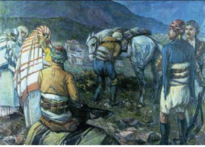
İbrahim Çallı, Zeybekler, 74x100cm, Tüyb, Ankara Resim ve Heykel müzesi, 1917.

Cumhuriyet'in ilanından sonra Kurtuluş Savaşı ve devrimlerle ilgili resimler yapar. Yukarıdaki tablosunu Ankara Etnoğrafya Müzesi'nde Osman Hamdi Bey'le açtığı sergide Atatürk görür: "Biz Kurtuluş Savaşı'nda ekmek zor buluyorduk, açtık, senin resimdeki atlar nasıl da semirmiş böyle" der. Bunun üzerine ressam boyası ve fırçasıyla atı zayıf bir hale getirir.